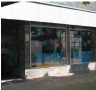
ehemals "Radio Schippers"