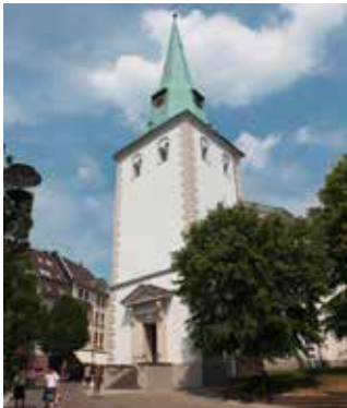
Evangelische Kirche Wald